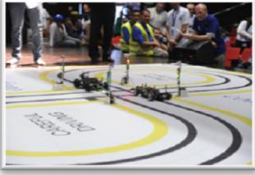
תחרות 'רובוטראפיק' השישית התקיימה בטכניון לכתבה המלאה