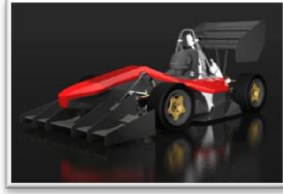
קווים לדמותו של רכב הפורמולה 2015 של הטכניון לכתבה המלאה