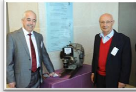
"מנועי בעירה פנימית ימשיכו להוות אמצעי הנעה עיקרי" לכתבה המלאה