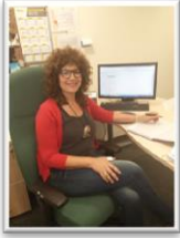
היצירתיות שמעבר להנדסה לכתבה המלאה