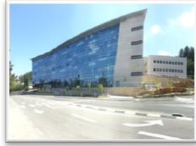
קליפ השלמת הבניין להנדסת מכונות ע"ש דן ובטי קאהן