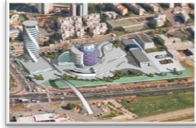
בוגרי הפקולטה מתגייסים להקמת בסמת החדש לכתבה המלאה