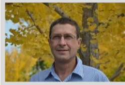
מגזין Science היוקרתי נותן במה לספינאופטיקה ולפרופ' ארז חסמן לכתבה המלאה